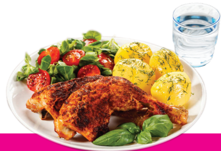
Folo ho'o fo'i'akau Xarelto milikalame 15 mg pe 20 mg fakataha mo ha'o kai