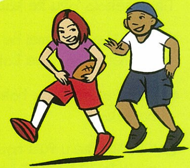
va'inga ha sipoti